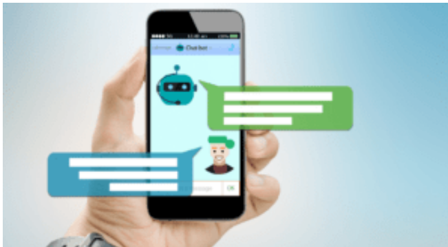
Aktuálně Sociální sítě